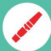
Штатные ремни безопасности