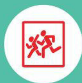
Опознавательные знаки «Перевозка детей»