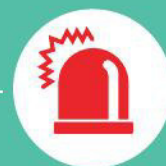
Маячок желтого цвета