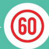
Опознавательный знак «Ограничение скорости»