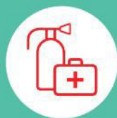
Огнетушитель и аптечка